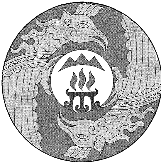
Герб муниципального образования «Онгудайский район» (пример воспроизведения в цвете)