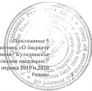
Объем поступлений доходов в бюджет муниципального образования "Куладинское сельское поселение" в 2018 году (тыс. рублей)